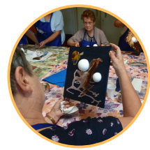
Au fil de l'art Ville de Gravelines