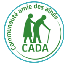
Communauté Amie des Aînés Communauté de Communes du Pays de Mormal