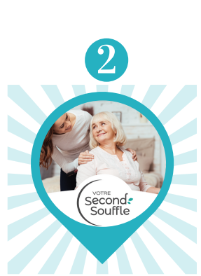
Service d'accompagnement et de relais pour les aidants Votre Second Souffle (Rezé)