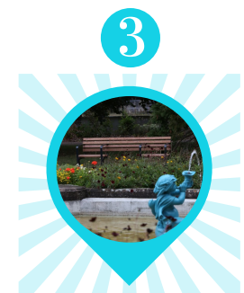
Des bancs adaptés dans la ville Ville de Belfort