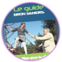
Le Guide Bron Seniors Ville de Bron