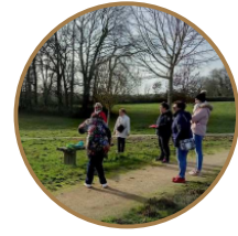
D-marche, c'est surtout pour tout le monde Fédération Sportive et Culturelle de France Vendée / ADAL (La Roche-sur-Yon)