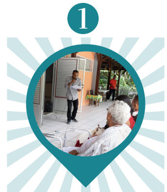
Fédérer et animer une communauté de grands seniors Ohana Clubs (Schoelcher)