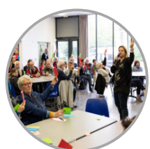
Le Grand Débat : Longévité, ouvrons le champ des possibles Nantes Métropole