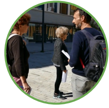
Des marches exploratoires avec les aînés Ville de Rennes