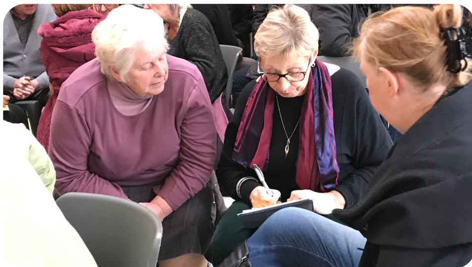
Une réunion collective d'étude d'opportunité.

Lors des audits menés en 2016, les aînés ont rejeté de manière unanime les EHPAD. Pour autant, la maison où ils vivent depuis longtemps n'est pas