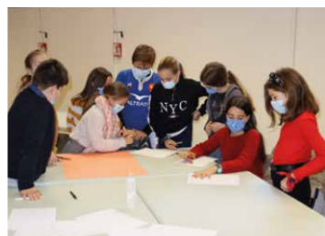
■ Mercredi 2 décembre, 1 ère réunion où les jeunes conseillers découvrent le fonctionnement de la démocratie. À l'étude :

Déjà très investis dans leurs nouvelles fonctions, les jeunes élus ont émis le souhait de réfléchir aux questions environnementales, intergénérationnelles et de propreté de la commune. Lors de leur 1 ère réunion, mercredi 2 décembre, les Conseillers Municipaux ont pris le temps de définir le rôle d'un enfant participant au Conseil Municipal des Jeunes et d'évoquer école par école leurs idées de campagne. Après moult réflexions le Conseil Municipal des Jeunes a choisi de participer à la Journée Mondiale de Ramassage des Déchets sous la forme d'un jeu de piste dans la ville. En parallèle, et afin de poursuivre leur apprentissage de la démocratie et des institutions, les jeunes élus vont se rendre au Mont Mouchet.