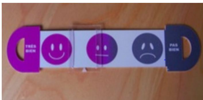
Une règlette permet aux personnes d'indiquer leur niveau de bien-être

Dans le cadre de ce projet, des interventions ont été organisées dans six EHPAD, ce qui a permis de tester le dispositif de jeu sur 54 patients atteints de la maladie d'Alzheimer. Ces interventions se sont déroulées pendant quatre mois, à hauteur de deux séances par