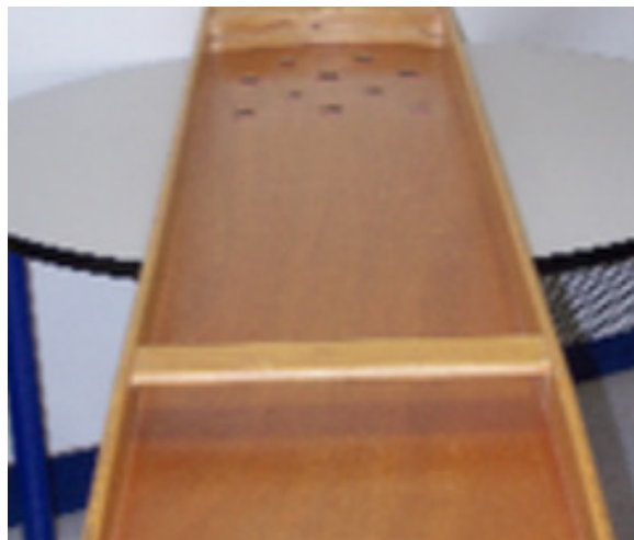
Le billard japonais ne laisse aucune ambiguïté quant aux règles du jeu

semaine. Au cours de celles-ci, un cahier d'observation a été tenu et l'outil de mesure principal qui a été utilisé était en fait une règlette permettant aux résidents d'indiquer leur niveau de bien-être à différents moments.