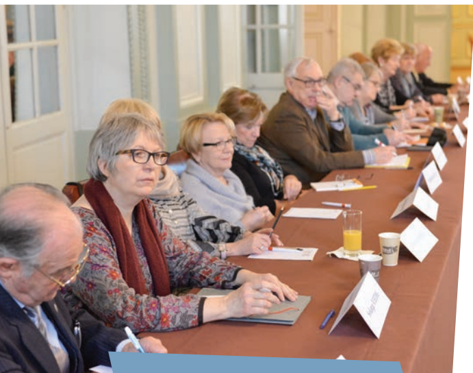
Séance plénière du Conseil des seniors.

Ce thème a été défini autour de deux grands axes :