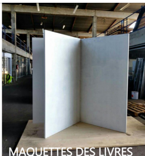
MAQUETTES DES LIVRES