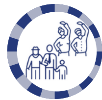
2B : Inclusion des aînés dans la société et citoyenneté