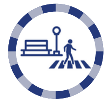
5B : Des environnements bâtis plus adaptés à l'avancée en âge