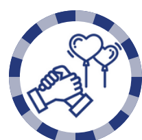
1B : Solidarité intergénérationnelle