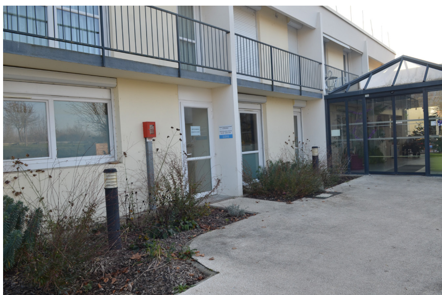
Centre Communal de Santé de Saumur 165 Rue Antoine Parmentier, 49400 Saumur 02 41 67 77 60

Face à cette double problématique, dans le cadre du contrat local de santé (CLS), la Communauté d'Agglomération Saumur Val de Loire a favorisé le rapprochement entre la Ville de Saumur et les médecins retraités à l'origine du projet, à la suite d'un groupe de travail intitulé « désertification médicale » mis en œuvre depuis novembre 2017.