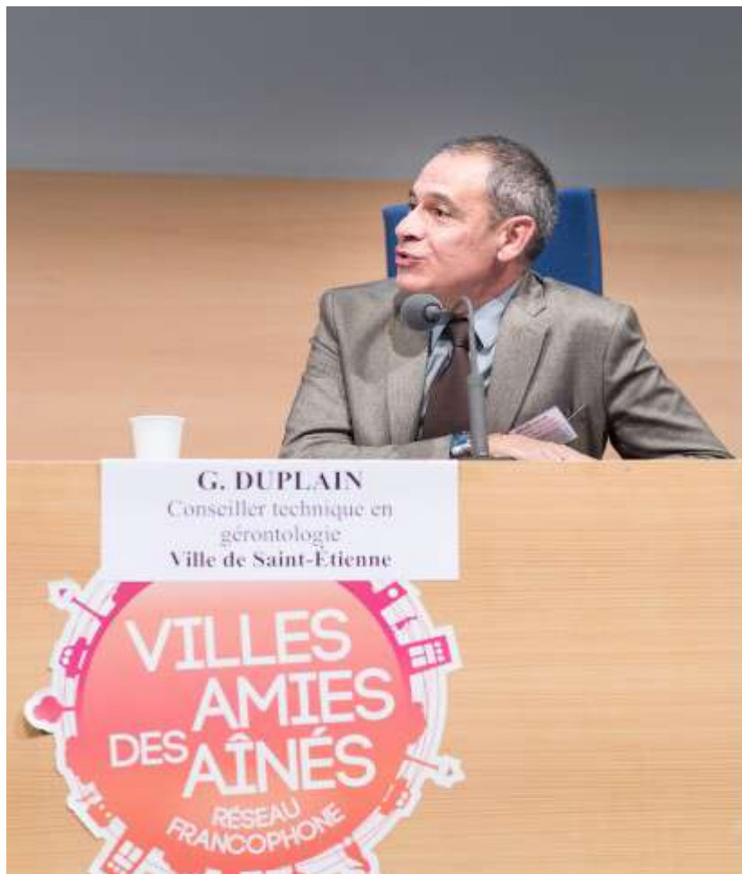
G. DUPLAIN Conseiller technique en gérontologie

En 2012, le CCAS a été sollicité par une personne âgée d'un quartier de Saint-Étienne nous expliquant qu'elle avait du temps disponible, des compétences -car elle était psychanalyste- et qu'elle se rendait compte qu'au sein de son quartier et de son propre immeuble il existait de nombreuses personnes isolées. Elle pouvait donner de son temps pour créer une action. C'est comme ça que s'est créé un groupe de parole qui était animé par cette dame et qui était à destination des personnes isolées. Ce groupe avait deux objectifs :