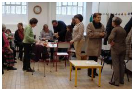
Une construction avec les habitants depuis mai 2015

partager du temps et de faire connaissance. EquipAges a été créé de façon participative et continue à l'être au quotidien. Les habitants avaient aussi laissé une cinquantaine de contributions de ce qu'ils voulaient voir sur EquipAges, ce qui nous permet de relayer leurs besoins et de les organiser. Ensuite, je ne sais pas si EquipAges améliore la démarche Villes Amies des Aînés, mais en tout cas je suis persuadée qu'il enrichit la démarche parce qu'EquipAges répond à sa manière à cette ambition forte du réseau qui est de dire que les seniors sont acteurs dans la ville. Notre démarche est citoyenne. Elle veut illustrer la place de chaque génération dans un quartier.