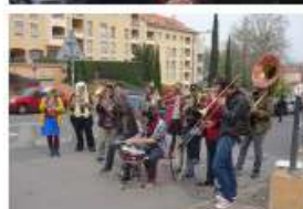
Portes ouvertes le 2/4/16 - 200 habitants