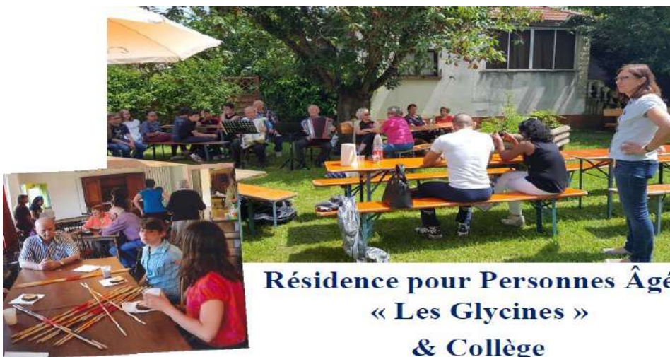
Résidence pour Personnes Âgées « Les Glycines » & Collège

La ville de Rixheim a décidé de se lancer dans le développement de l'intergénération dès 2013. Pour débiter, quelques rencontres ont été menés entre les élèves du collège et les résidents de la résidence autonomie: « Les Glycines ».