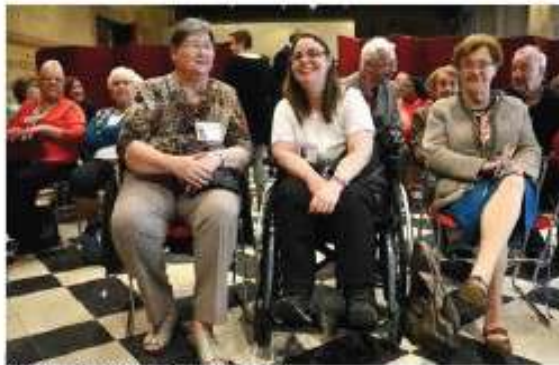
(© Saskia Vanderstichele)

L'évaluation qualitative du projet se fait lors des rencontres mensuelles. La Vrije Universiteit Brussel a conduit des interviews qualitatives un an après le démarrage. Deux nouvelles antennes ont été ouvertes suite aux évaluations. L'analyse de ces interviews a fait ressortir les données chiffrées suivantes : le plus jeune participant était âgé de 41 ans, le plus âgé, de 99 ans. L'âge moyen était de 77 ans. Au bout de six semaines, 24 participants avaient signé une convention. En quelques mois, le réseau était devenu assez grand pour pouvoir répondre à la plupart des questions. Au début, trente personnes ont reçu de l'aide. De janvier à décembre 2014, 673 prestations ont été délivrées, ce qui représentait en tout 812 heures enregistrées. La durée moyenne d'une prestation était de 73 minutes. Les prestations réalisées sont : visite (33%), achats (18%), transports (14%), petites tâches ménagères (10%), conseil (5%), emploi (3%), administration (3%) autres (9%). Le volontaire le plus actif a effectué 146 heures. Le plus grand nombre de demandes d'aide pour une seule personne était de 150 heures. Au bout d'un an, 59 conventions de bénévolat ont été signées.