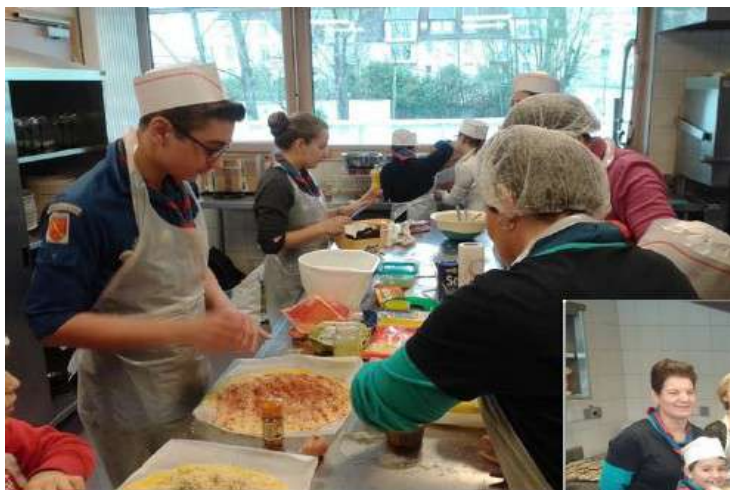
Atelier pâtisserie - Scouts & Adultes